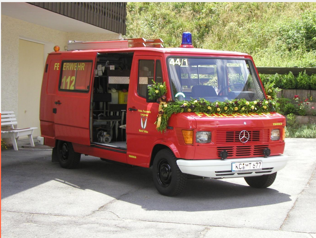
Einweihung des neuen TSF am Feuerwehrhaus Langenau

Die feierliche Einweihung des Fahrzeugs der Marke Mercedes-Benz fand schließlich am 27.07.2008 statt. Von der Vorstandschaft wurden langjährige Mitglieder für ihre Treue geehrt.