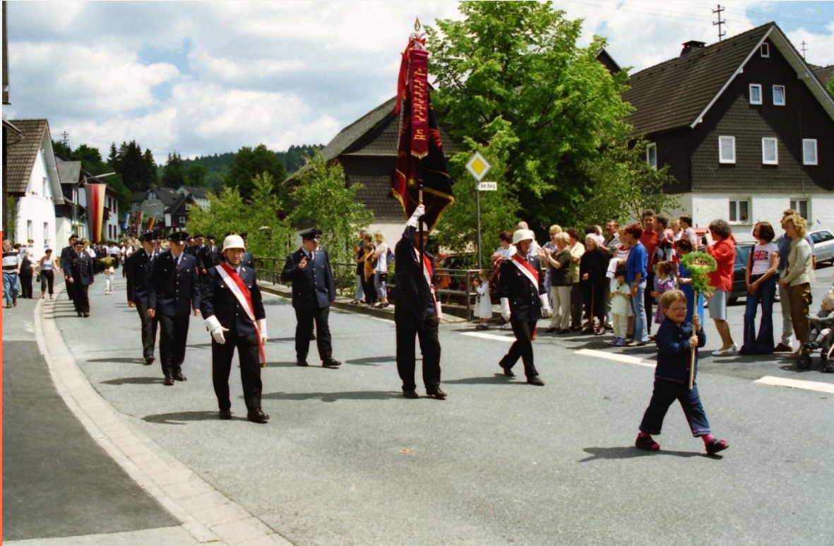
Die Jubiläumswehr beim Umzug am Festsonntag