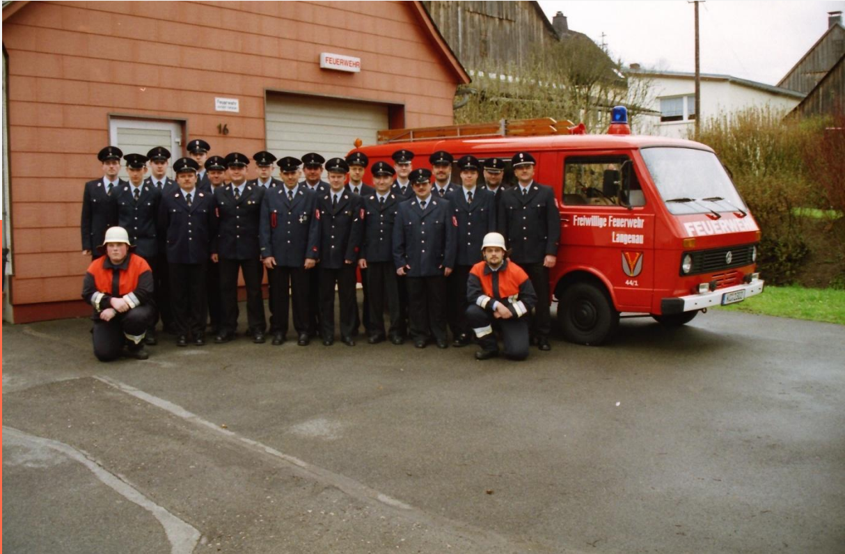
Die Wehr im Jubiläumsjahr 2001