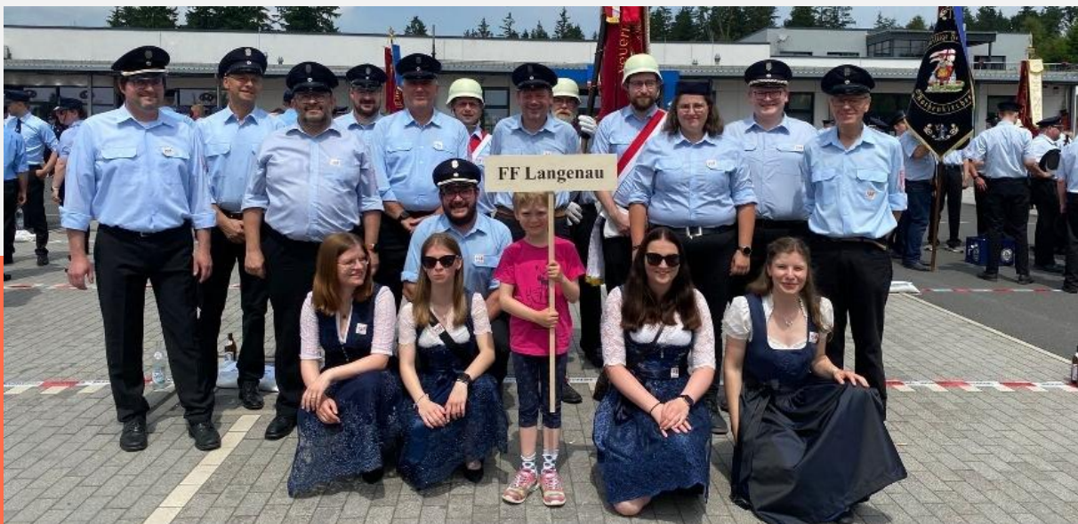
Feuerwehrfest Steinbach am Wald 2025