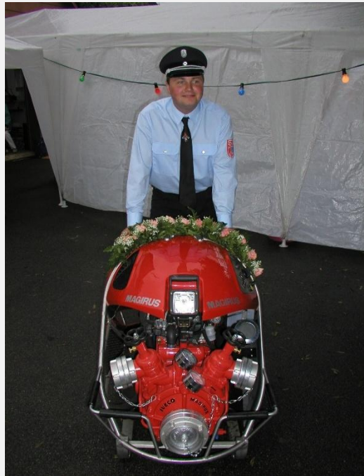
Einweihung der neuen TSP im Jahre 2003

Am 24.08.2004 werden die Kameraden zu einem Glaswannenbruch bei Tettauer Glas alarmiert.