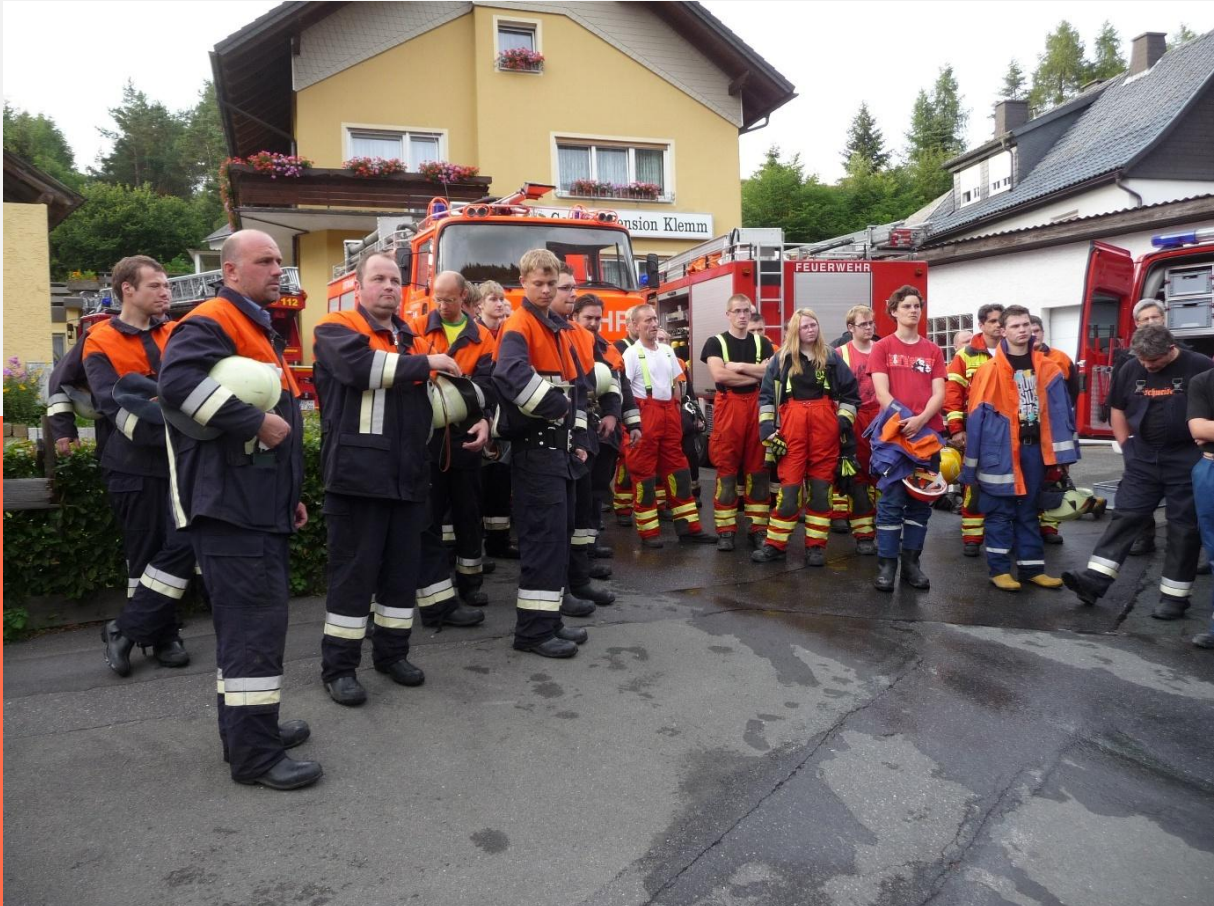
Die Großübung der Feuerwehren des Marktes Tettau am 29.07.2011 beim Gasthaus Klemm

2011 Am Nachmittag des 16.06.2011 wollte der Eigentümer des „Sonnenhofs“ Unkraut rund um seine Scheune vernichten. Dabei entzündete sich ein Feuer. Die Flammen griffen schnell auf die Holzverschalung über und plötzlich stand das Dach des Gebäudes in Flammen. Durch das schnelle Eingreifen der Feuerwehr konnte ein Übergreifen des Feuers auf benachbarte Gebäude verhindert werden. Insgesamt waren 70 Feuerwehrleute im Einsatz. Verletzt wurde glücklicherweise niemand.