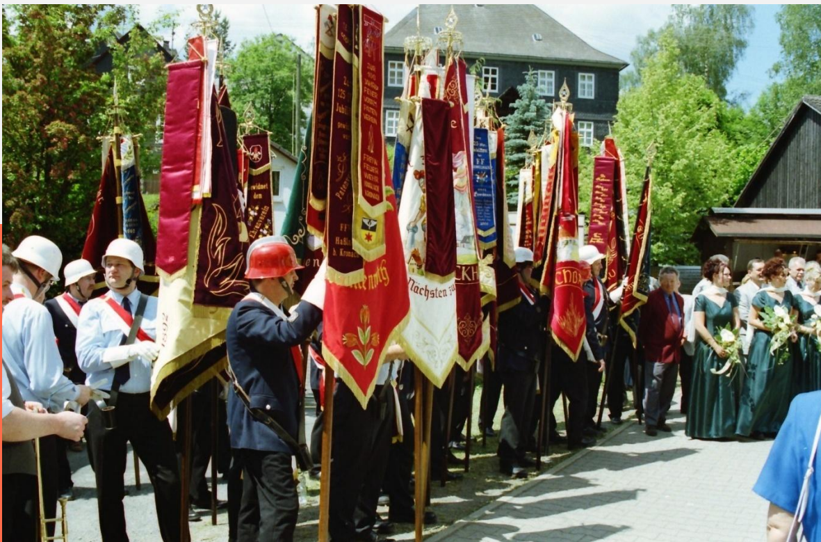
Fahnenabordnungen der am Umzug beteiligten Feuerwehren