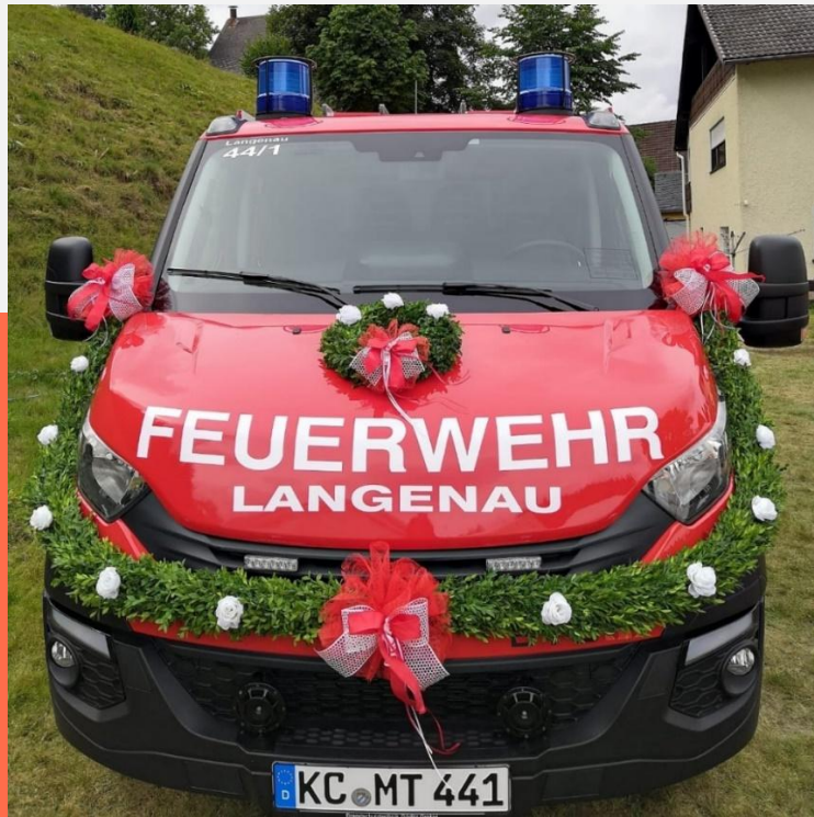
Das festlich geschmückte TSF Iveco Daily bei der Einweihung 2019