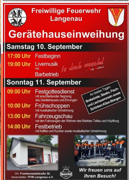
Die neue Fahrzeughalle als Anbau an die Turnhalle wurde schließlich am 11.09.2022 feierlich eingeweiht.