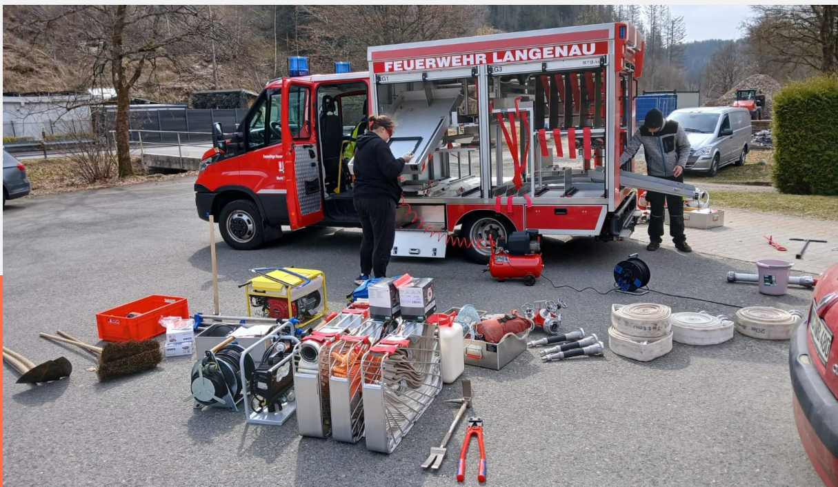
Reinigung TSF im März 2025