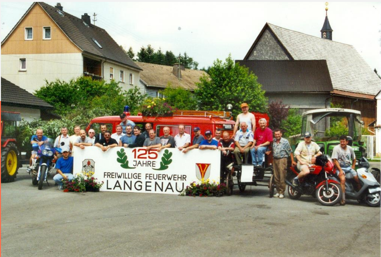
Aufstellung der Helfer zum 125-jährigen Jubiläum