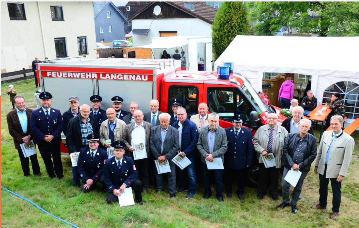
Ehrung von Feuerwehrkameraden anlässlich der Einweihung des TSF