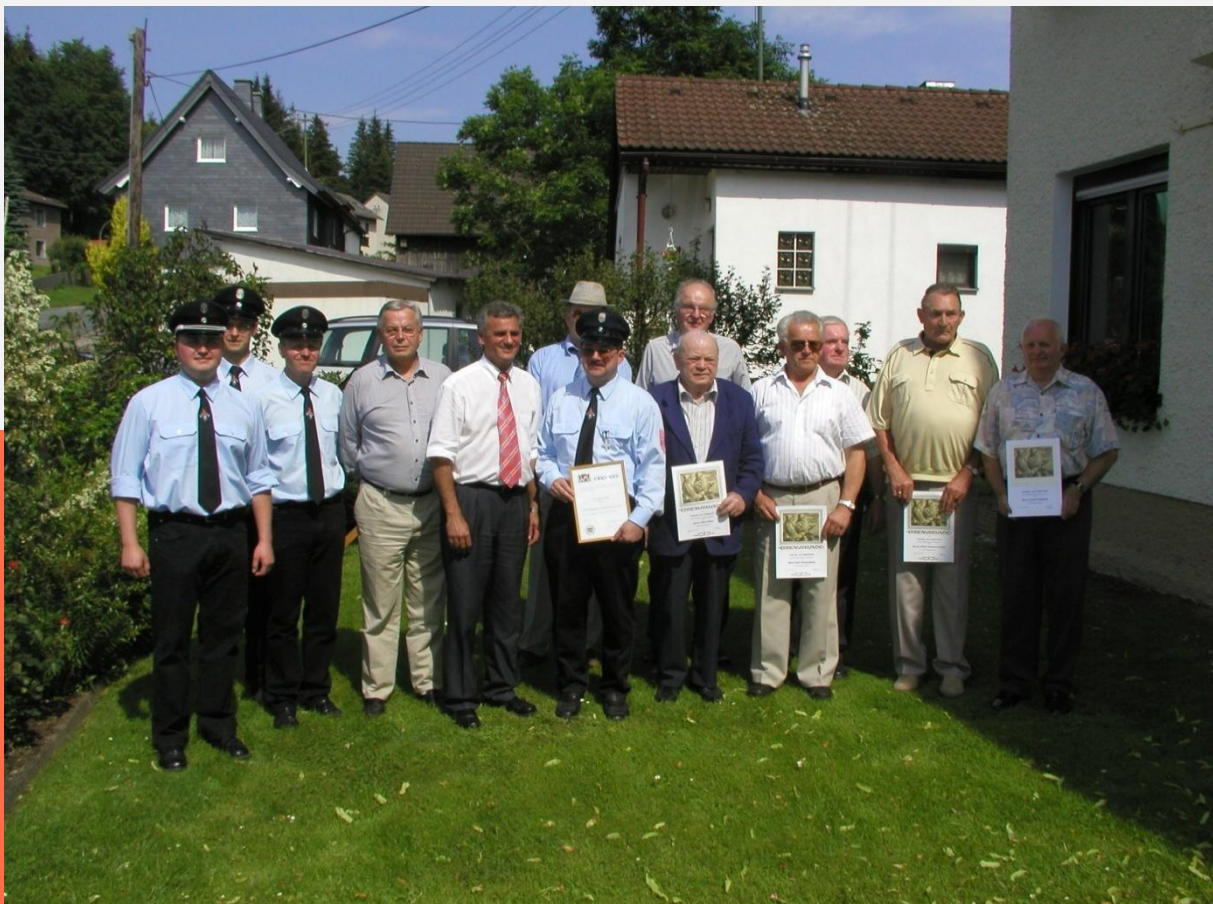
Ehrungen anlässlich des Feuerwehrfestes 2004