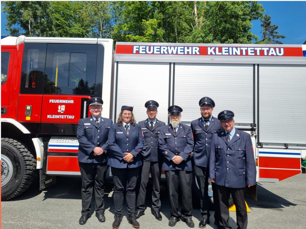
Besuch anlässlich der Einweihung LF10 der Feuerwehr Kleintettau im Juni 2025