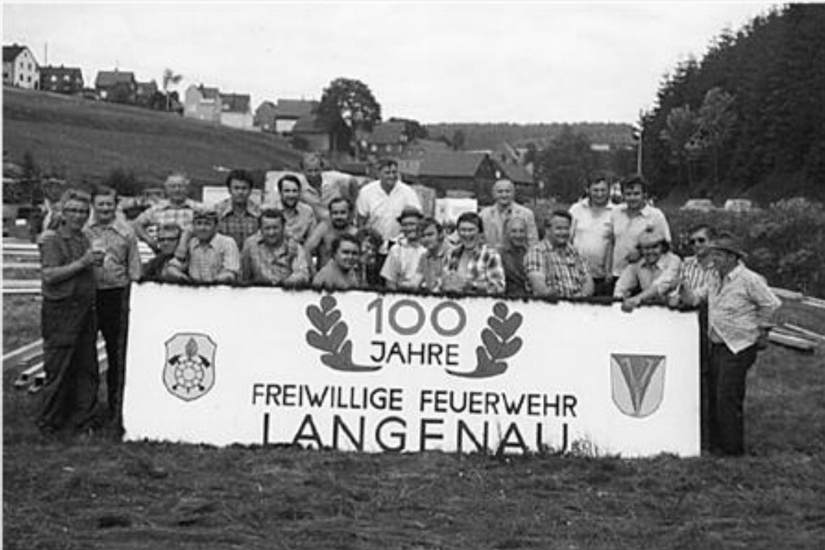
Die Helfer und ...