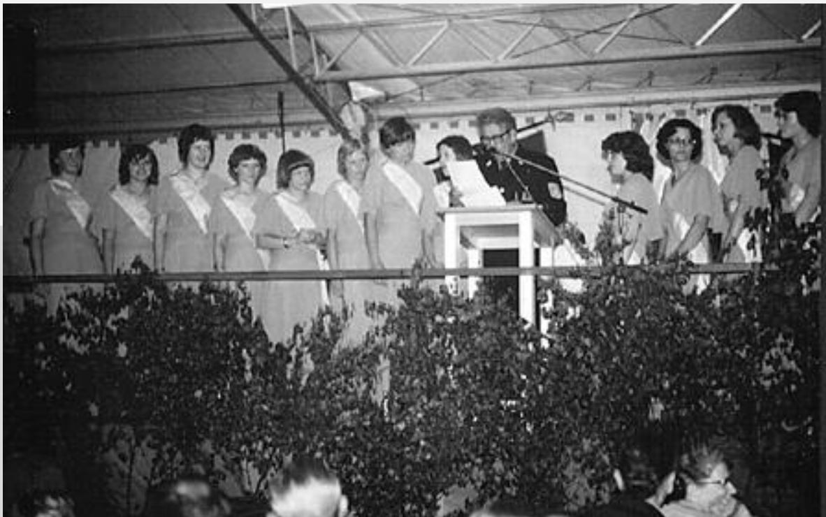
... die Ehrendamen zum 100-jährigen Gründungsjubiläum der FFW Langenau 1976.